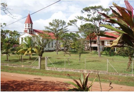
Brødrekirke i Puerto Cabezas i Nicaragua