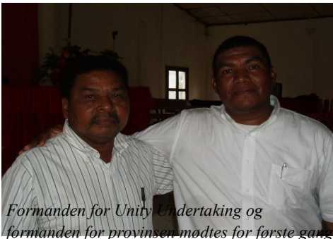
Formanden for Unity Undertaking og formanden for provinsen mødtes for første gang

Derudover er der andre problemer. Der har for år tilbage været borgerkrig i Nicaragua og en del af menighedens bygninger, herunder et stort hospital, blev ødelagt. Desuden hjemsøges områderne i begge lande af orkaner og kokain-smugling er et stort problem. Der er ca. 85.000 medlemmer i Nicaragua og omkring 35.000 i Honduras. Der kan kun opfordres til at bede for vore brødre og søstre i Nicaragua og Honduras.