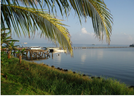
Byen Puerto Lempira, hvor Brødrekirken i Honduras har hovedkontor, ligger ned til en lagune.

Derudover er der andre problemer. Der har for år tilbage været borgerkrig i Nicaragua og en del af menighedens bygninger, herunder et stort hospital, blev ødelagt. Desuden hjemsøges områderne i begge lande af orkaner og kokain-smugling er et stort problem. Der er ca. 85.000 medlemmer i Nicaragua og omkring 35.000 i Honduras. Der kan kun opfordres til at bede for vore brødre og søstre i Nicaragua og Honduras.