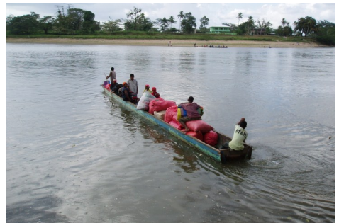
Rio Coco floden mellem Nicaragua og Honduras blev krydset i en udhulet træstamme.

Brødrekirken i Nicaragua blev grundlagt i 1848 blandt Miskito indianerne i den østlige del af Nicaragua, hvor kirken stadig har de fleste medlemmer. Brødrekirken i Honduras blev grundlagt omkring 1930, også blandt Miskito indianerne. Begge lande er ret fattige og især de områder, hvor Brødrekirken befinder sig, er præget af fattigdom.