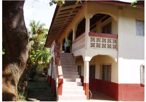
Brødrekirkens hovedkontor i Puerto Cabezas i Nicaragua

Dog var der kort før besøget opstået en ny konflikt inden for den karismatiske gruppe i Honduras.