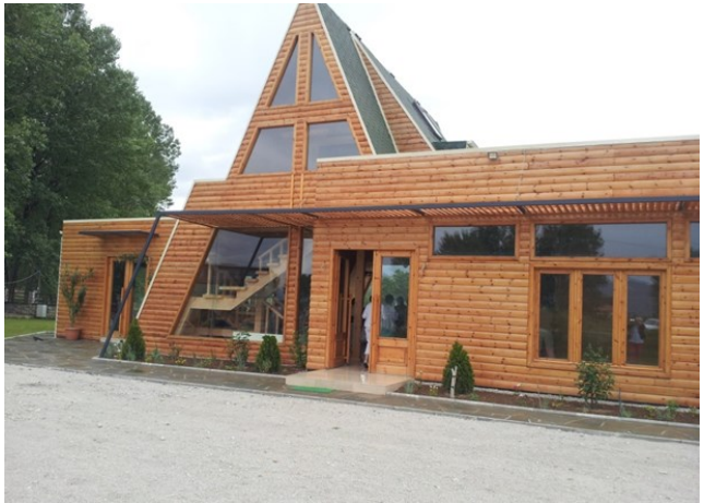
Det flotte Voloreka Campcenter, som er bygget for penge fra bl.a. Y-mens Club Danmark