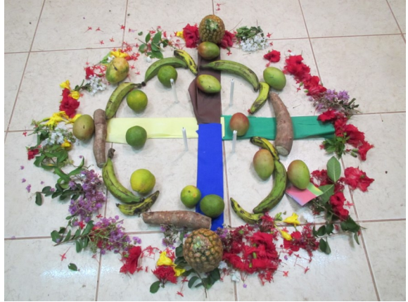
Miskitu-indianernes forståelse af verden og tilværelse illustreret