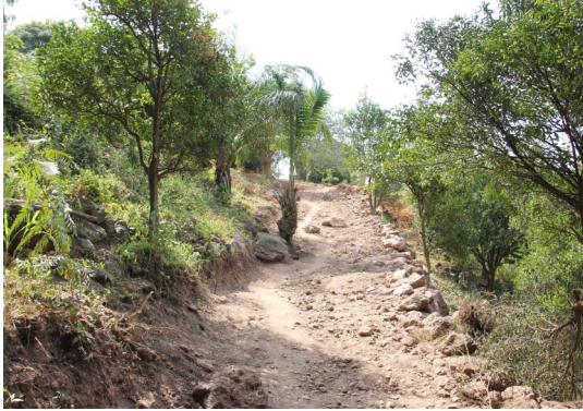
Vejen op til børnehjemmet