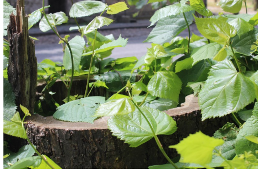
Et af de gamle træer som blev fældet i foråret, der var kun en skal tilbage

De gamle lindetræer på kirkepladsen har i ca. 240 år prydet kirkepladsen og dermed været til glæde i byen i flere generationer for såvel menigheden, byens borgere som byens turister.