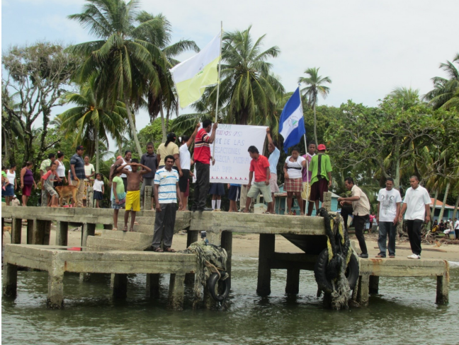
Modtagelse i landsbyen ved flodudmundingen

Området præges af store laguner og mange floder og mange af menighederne ligger ved floderne. Vi besøgte blandt andet to landsbyer, der var meget specielle, fordi de fleste af disse landsbyers indbyggere var Brødre-kirkemedlemmer. Den ene landsby lå hvor en flod løber ud i det Caribiske Hav, folk levede af fiskeri og de kunne både fange havets og lagunens fisk og skaldyr.