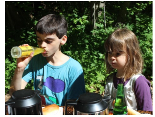
Tak for en dejlig dag til sjov søndag teamet m. flere

Aktivitetsplanen for det næste halve år ligger nu parat og vil være at finde her i bladet, men vil også blive sendt pr mail. Med venlig hilsen