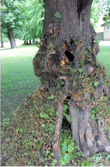
Træet står endnu, men det er hult

De gamle lindetræer på kirkepladsen har i ca. 240 år prydet kirkepladsen og dermed været til glæde i byen i flere generationer for såvel menigheden, byens borgere som byens turister.