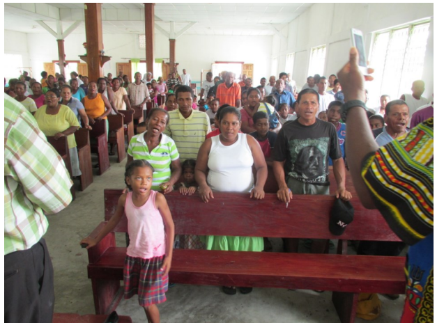
Mange mennesker kom hen i kirken og tog imod os

En af aftenne var der arrangeret en såkaldt kulturel aften, som viste sig at være yderst interessant.