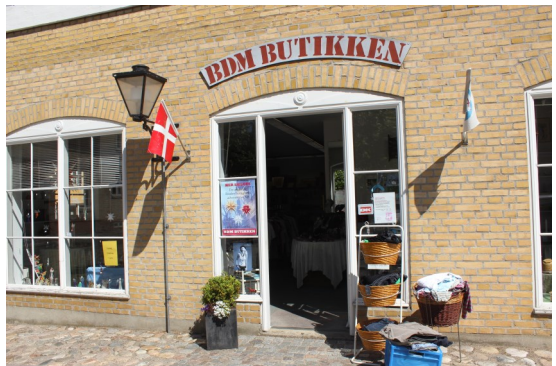
BDM Butikken Prætoriestorvet

Man kan f.eks. tilbyde sin hjælp som medarbejder i en af forretningerne nogle timer om ugen, eller man kan handle i forretningerne, man kan også donere ting, som man ikke længere selv har brug for, men som stadigvæk har en værdi, og derfor kan sælges i forretningerne, og så på den måde støtte missionsarbejdet.