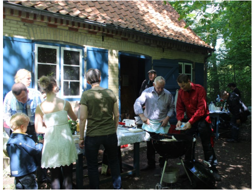
"Sjov søndag" i Christinero

Sjov søndag har nu været praktiseret et halvt år. Der har været deltagende børn (og voksne) næsten hver gang, og det har været rigtig hyggeligt. Der er blevet leget, klippet, malet, dekoreret og plantet blomster. Der blev hver gang snakket om, hvad der lige var aktuelt i forbindelse med den enkelte gudstjeneste. Der er blevet pustet æg og lavet æggekage, hvor de der havde lyst efter gudstjenesten, kunne komme i Duetten og smage. Dog gik det lidt i vasken, da vi for sent fandt ud af, at ovnen ikke virkede. De der havde tålmodighed til at vente på, at æggekagen blev bragt og bagt i Ellens ovn, fik lov til at nyde den efterfølgende.