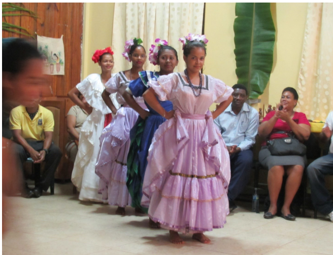
Mestizo gruppens danse er meget spansk inspirerede