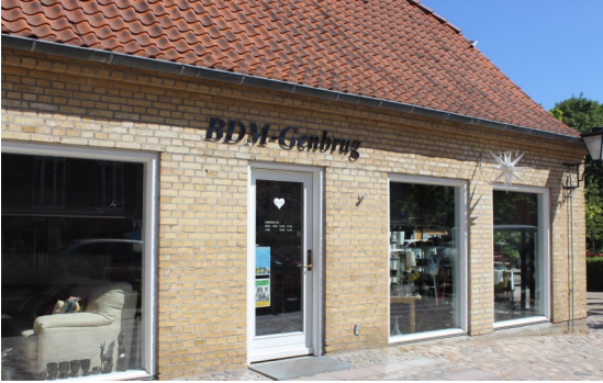
BDM Genbrug Prætoriestorvet

udsendinge personligt, og ved meget om det de arbejder med. Det personlige kendskab til medarbejderne og BDM's arbejde betyder rigtig meget for menigheden, og for den enkelte af os, da det giver et større engagement, når man ved, at det nytter at hjælpe. Det gør det mere nærværende og hjælper os til at fortsætte med at støtte arbejdet