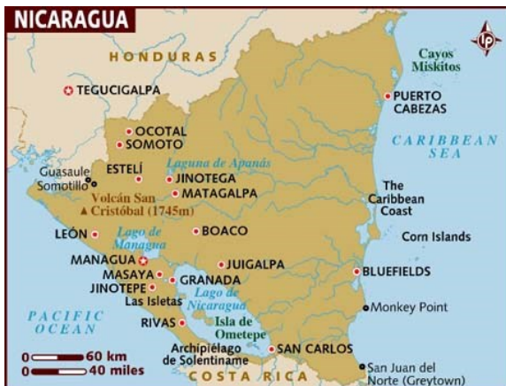
Kort over Nicaragua. Brødrekirkens område er hovedsageligt, men ikke kun på landets østkyst

Brødrekirken i Nicaragua blev grundlagt i 1848 blandt Miskitu indianerne, hvis område ligger i den østlige del af Nicaragua og Honduras i området La Mosquitio.