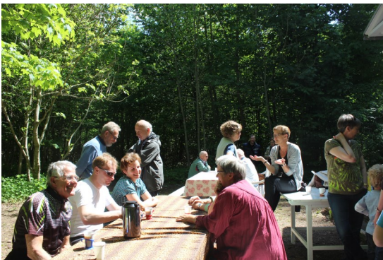
Der snakkes og hygges

Det var en rigtig fin tur, hvor solen skinnede fra en skyfri himmel.