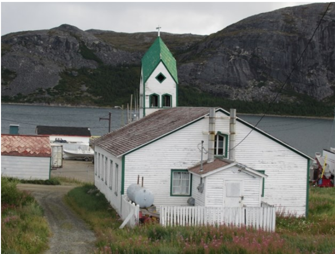
Brødreirken i Nain

også missionærer med. Da de ankom, foretog de noget handel med de lokale inuitter og satte 6 missionærer i land ved bopladsen, en boplads, som man senere gav navnet Hopedale, på tysk Hoffenthal, eller på dansk - Håbets Dal. Skibet begyndte at sejle tilbage, men blev råbt an af nogle inuitter efter et stykke tid. Erhardt, kaptajnen og fire søfolk sejlede i land, men efter to dage var de ikke kommet tilbage til skibet. Man sejlede tilbage til Hopedale og blev enige om, at de 6 efterladte missionærer skulle tage med tilbage, ellers var der ikke folk nok til at håndtere skibet. Året efter fandt en anden ekspedition ligene af de 6 savnede. Erhardts første forsøg på mission i Labrador endte altså med, at han blev dræbt.