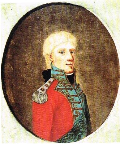
Christian den VI af Danmark

Grev Zinzendorf var en halvfætter til Enkemargrevinde Sophie Christiane af Brandenburg- Culmbach. Denne kvinde var dronning Sophie