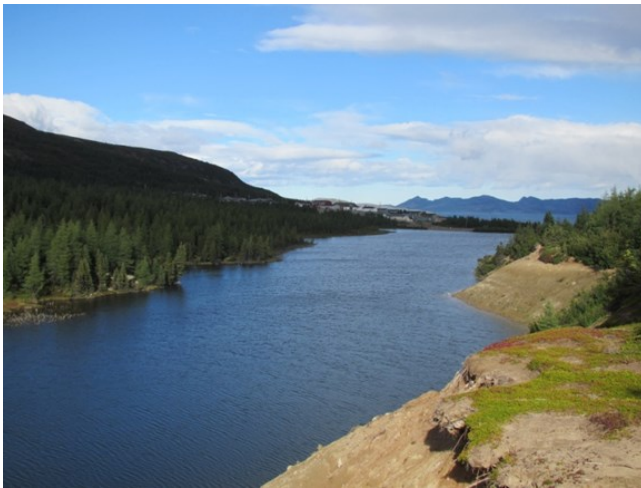
Smuk natur uden for Nain

Undertegnede besøgte Labrador i min egenskab af Unity Business Administrator i september 2013. Labrador er en lille selvstændig Missionsprovins, har fire menigheder, nemlig, Nain, Hopedale, Makkovik og Happy Valley. Der har i tidens løb være flere danske missionærer i Labrador, foruden to voluntører for nogle år siden.