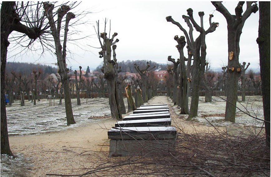
Anna Nitschmann ligger begravet ved siden af Zinzendorf på midtergangen på Gudsageren i Herrnhut

Efter knap 3 års ægteskab døde hun, den 21. maj 1760, kun 44 år gammel, og kun 12 dage efter Zinzendorfs død.