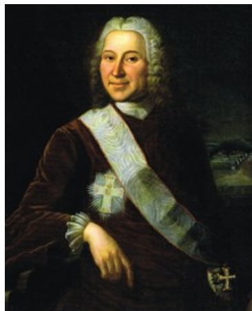
Zinzendorf med Dannebrogordenen 1735

Ankommet til København blev han modtaget af kongen og dronningen, samt andre kongelige personligheder. Zinzendorfs indstilling til de kongelige kom bl.a. til udtryk i den bøn, som sluttede hans hyldestdigt i anledning af salvelsen: "Giv dette guddommelige par, at byrden bly ikke er tungere end vægten af guldet på hans krone". - Kongen tildelte Zinzendorf Dannebrogordenen med det hvide bånd (Storkors af Dannebrog), hvorved han i rang blev stillet lige med landets øverste. Han var i tvivl om, hvorvidt det kunne forenes med hans virksomhed for evangeliet og missionen, men han blev indtrængende rådet til af markgrevinden at modtage det.- Om Zinzendorf var skuffet over, at han ikke modtog Elefantordenen, Rigets fornemmeste kan nok diskuteres, men hans indstilling til den tildelte orden er måske ganske klart udtrykt i et brev til hans hustru: "Den orden, som kongen har givet mig, er meget smuk, jeg er meget glad for den, da den har overmåde meget til fælles med min profession.