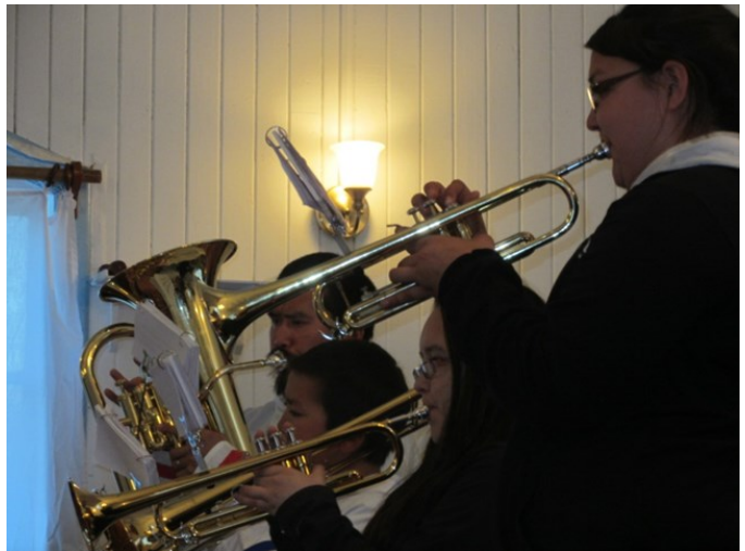
I adskillige år var blæserkorarbejdet i Labrador ophørt, men nu har man startet igen i Nain. Blæserne må indtil videre betragtes som 'let øvede,'men de skal nok blive dygtige.