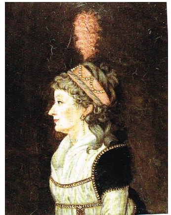
Sophia Magdalena af Danmark

Enkemargrevinden havde siden 1721 brevvekslet med Zinzendorf,- og hun havde bl.a. opfordret ham til ikke at trække sig tilbage til et stille liv, men tværtimod bruge de muligheder og evner, som han havde. Dronningens mor var pietistisk from, og læste med interesse den “Historische Nachricht von meiner