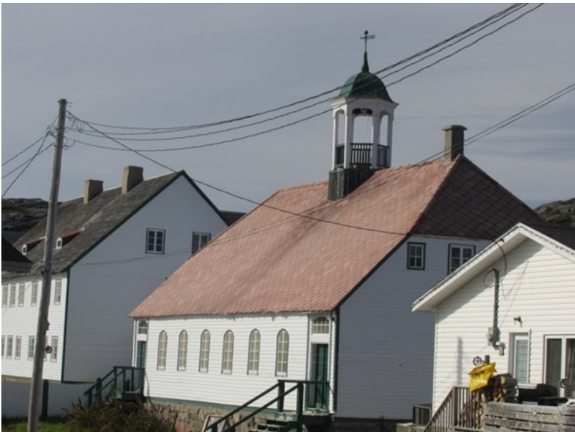
Samlingen af historiske Brødremenighedsbygninger i Hopedale er Labradors betydeligste. Her kirken og ved siden af Gemein-haus, 'hvor missionærerne boede. (Etableret 1782)