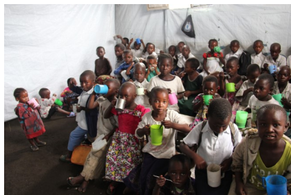
Klasseværelset i kirken

den har haft et stort ønske om at få en skole tilknyttet. Lige nu går der ca. 80-90 børn i 0. og 1. klasse. Klasseværelset er kirken, og der er blot hængt et lagen op mellem de to ”klasseværelser”. I den forbindelse har vi søgt Y’s-Men i Danmark om støtte, og de har bevilget 300.000 kr. til formålet. Det betyder, at vi efter al sandsynlighed kan gå i gang med byggeriet til efteråret. Det er stort!