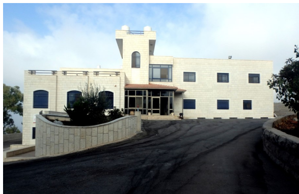
En af bygningerne på Star Mountains grund

Udover oplysningsarbejdet om pubertet gør medarbejderne meget ud af at forklare vigtigheden i at se efter misbrug, da mange handicappede piger og drenge bliver misbrugt både psykisk og seksuelt. Hvis et misbrug bliver opdaget, sætter Star Mountain