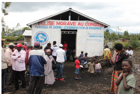
Kirken som fungerer som skole i Goma i DR Congo