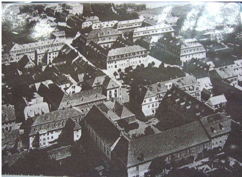
Foto af Herrnhut før branden i maj 1945