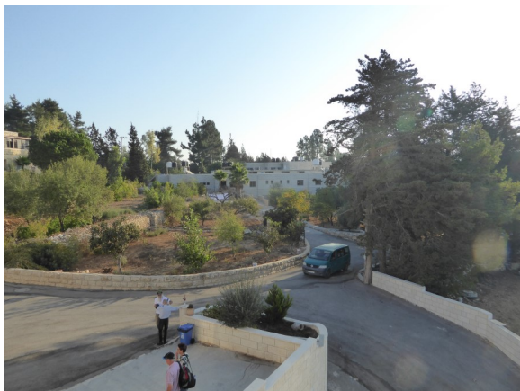
Star Mountain henter de handicappede i deres minibus